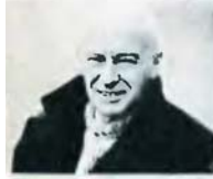
Р. Кармен («Гренада, Гренада, Гренада моя»)