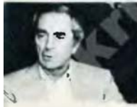
М. Антониони («Профессия: репортер»)

Жан ДРЕВИЛЛЬ (Франция): «Репортер должен уметь показать существенное и неуклонно стремиться к правде. Спустя два года после войны я снял ленту о том, как гитлеровцам помешали захватить запасы тяжелой воды—ценнейшего атомного сырья, находившегося в Скандинавии. В съемках участвовали подлинные герои эпопеи. И они заключили со мной контракт, который формально запрещал мне показывать то, чего не было ими совершенно на самом деле. Во время работы над «Нормандией—Неман» годы боев надо было сжать в минуты. Поседевшие летчики полка не снимались, их играли молодые актеры. Но ветераны контролировали все. И я подчинялся, понимая важность правды, точности даже в полудокументе».